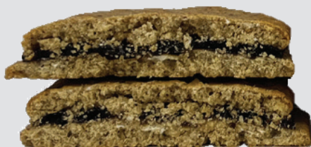
Control de proteína alta

consigue un mayor volumen y una textura más blanda en las barras enriquecidas con un 30% más de proteínas