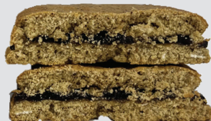
Muestra de prueba de proteína alta con LEVAIR® Fortify